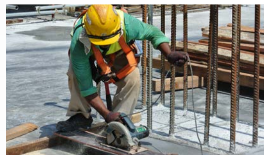
ARTISANS / INTERVENTION D'URGENCE