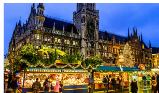
MARCHANDS / STELLERS